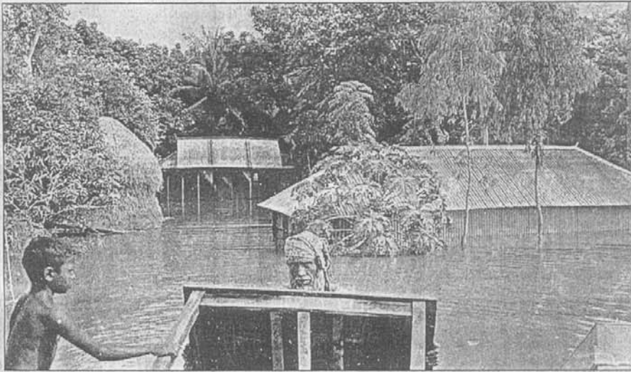
বন্যার পানিতে ডুপিয়ে আছে সিরাজগঞ্জ পৌরশহরের রানীগ্রাম এলাকা। ভূবে বাতারা বাড়িঘর থেকে মালামাল অন্যত্র সরিয়ে নিতে ব্যস্ত লোকজন